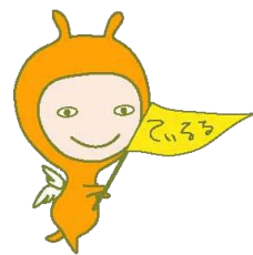
沖縄県男女共同参画センター マスコットキャラクター「ているるちゃん」

参加ご希望の方は、下記の表に必要な事項をご記入いただきFAXで送信してください。電話・メール・ホームページからお申し込みができます。お申し込み後、3日以内に受講に関する連絡がない場合はFAX・メールが届いていない場合がありますので、お問い合わせください。