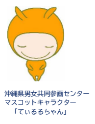
沖縄県男女共同参画センター マスコットキャラクター 「ているちゃん」