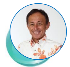
塾長 玉城 デニー 沖縄県知事