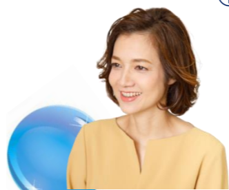
なみのうえ 波上 こそみ 氏 Cosmic Consulting 代表 組織コンサルタント