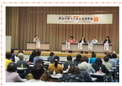
▲ 助成を受けられた団体様の講座・講演の様子です♪