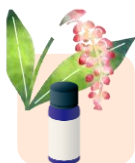
イラストはイメージです