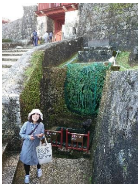
首里城内(那覇市)瑞泉門側にある湧き水「龍樋(りゅうひ)」

「飲めなくてもいいのです。災害時に飲む水はペットボトルが配布される可能性が高いですが、それとは別にトイレの水や手を洗う水、洗濯や掃除する水、そして火を消す水などが必要になります。そういった水は上水道が壊れたときに確保するのが難しくなると思います。そんな時に自分の住んでいる地域にある井戸について知っていたら、大部分が補える可能性があります。でも災害時とはいえ普段触れてもない井戸の水を扱うのは怖いんですよね。そこで日頃から接することができるきっかけにしてほしいと思い、情報を収集・発信しています」とぐしさん。