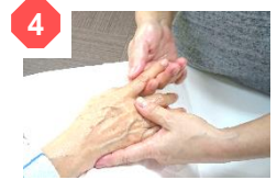
親指から順に小指まで1本ずつ軽く握りながら、関節をくるくると撫でる。