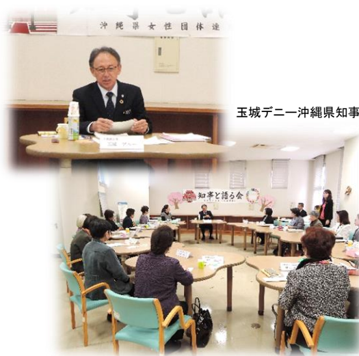
玉城デニー沖縄県知事