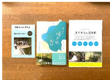
「浦添市湧き水MAP」(左)、 「おきなわ湧き水紀行」(真中) (ポーターインク) 「湧き水fun倶楽部 冊子」(右)

『湧き水fun倶楽部』が製作した資料は、浦添市の「湧き水MAP」。その次に市の助成を受けて作成した「浦添の湧き水」。場所だけではなく防災情報などもまとめている。2016年からは、琉球大学「水の環でつなげる南の島のプロジェクト」にも参加している。