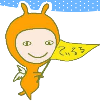
沖縄県男女共同参画センター マスコットキャラクター 「ているるちゃん」

玉城知事を塾長とする女性人材育成講座「ているる塾」が令和元年度からスタートし、3年目となります。『ているる塾』では、女性が様々なライフステージの中で自分の持てる能力を最大限発揮するため、ネットワーク、マネジメント力、論理的思考力等を伸ばし、職場、家庭、地域のあらゆる場で活躍できる人材を育てます。昨年は22名の塾生が修了しました！今年も出前講座としての開催が決定しました♪お気軽に「ているる塾」を体験してください！